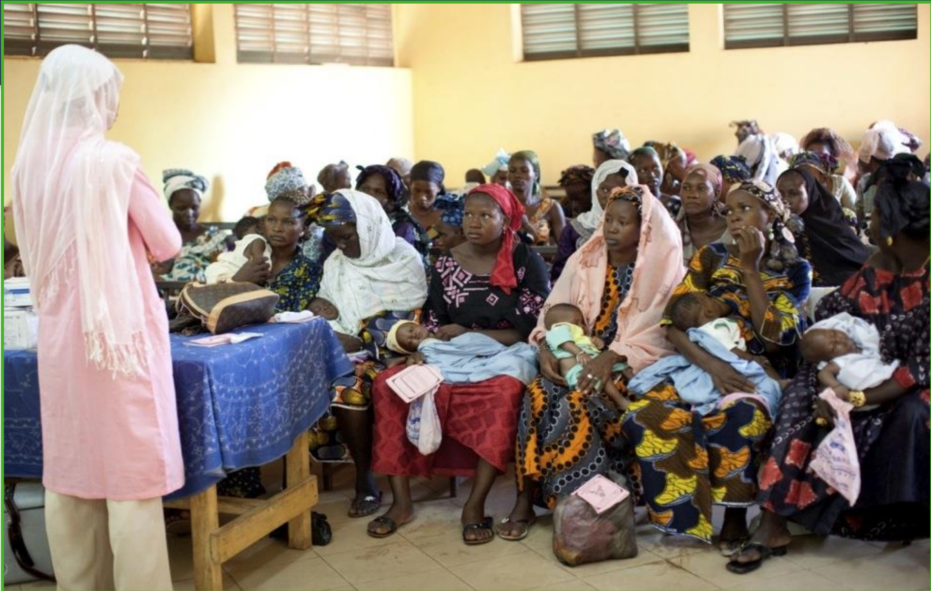
Intégration PF dans la vaccination: séance de sensibilisation au CSCCom sur la PF